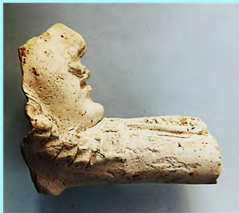
Nieuwe vondst Willem III pijp. Zie pagina 58