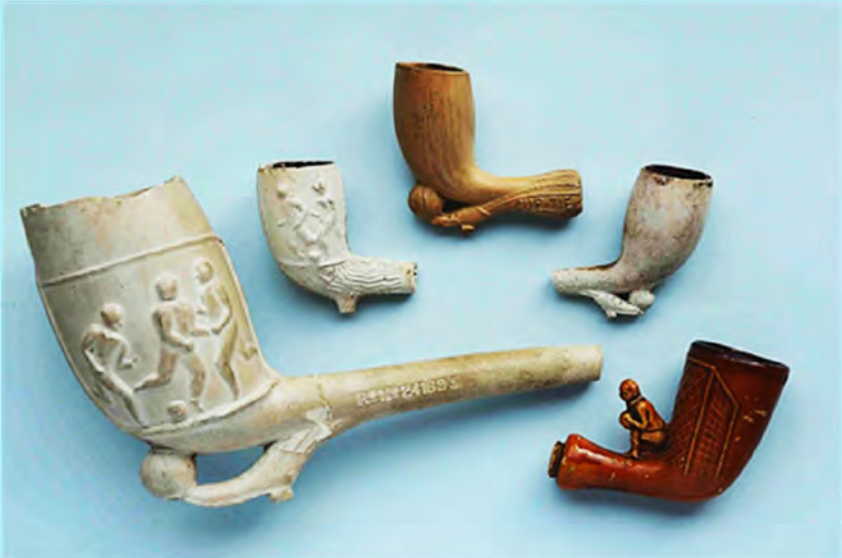
Een pijp ter gelegenheid van de bouw van 'Stadion Feyenoord' in 1937. Zie pagina 51