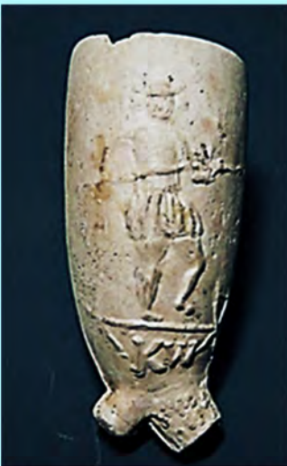
Koorddanser in beeld. Zie pagina 60