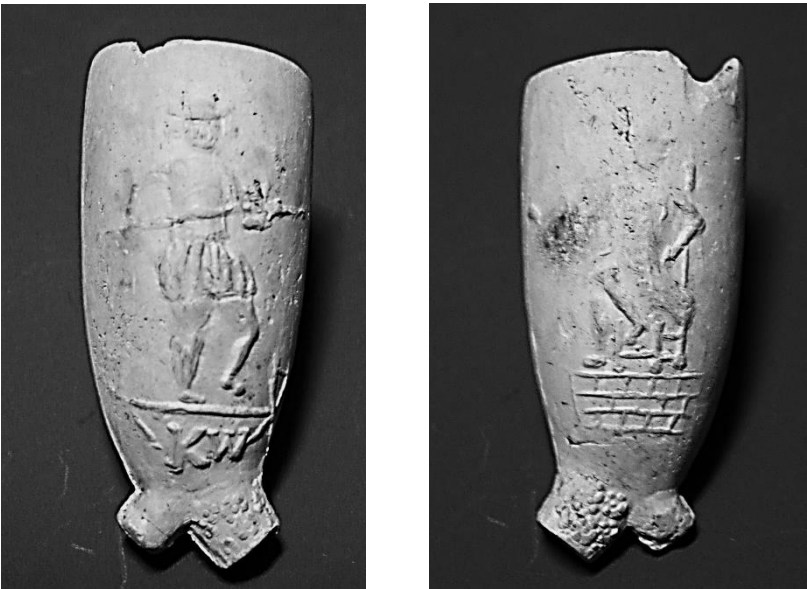
Afb. 5a-b. Koorddanser met KW en man op de stoel. 1755-1805. Vindplaats Gorinchem, stadswal bij de Krabsteeg.