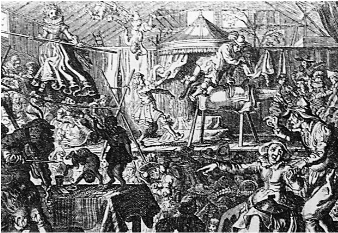
Afb. 1. Koord- dansers-spel (uit: Schotel)

maar tussen twee stel gekruiste stokken. Op dezelfde pagina van de beschrijving in Schotel vinden we een afgebeelde prent, met het onderschrift "Koorddansersspel". We zien hierop in een grote ruime (boeren)schuur twee podia, waarop op ooghoogte, allerlei kermisactiviteiten plaats vinden. In het midden, tussen de podia, is een breed pad waar de kermisgasten zich bewegen en vermaken met de capriolen van de kermisklanten. In dit middenpad, is ook hier het koord gespannen tussen twee stel gekruiste houten staken. Hoog boven de bewonderaars, toernt op het koord met balanceerstok een prachtig uitgedoste joffer met wijde rokken en een strak gesteven, ronde kanten kraag. (afb. 1)